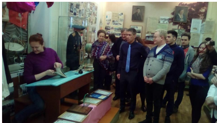
Экскурсия для преподавателей и студентов КрасГАУ