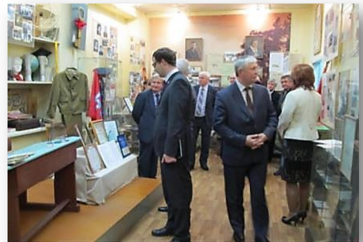
Экскурсия для депутатов Законодательного собрания Красноярского края